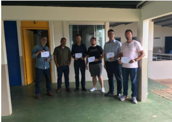
Equipe maçônica loja Areópago de Brasília