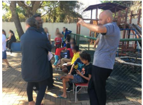
Fila de espera