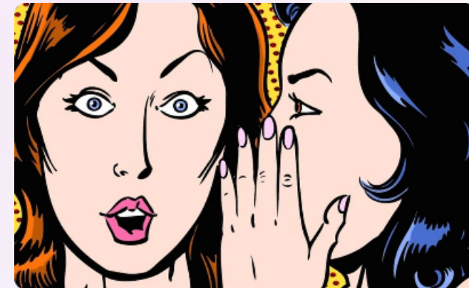
Calúnia, difamação e injúria