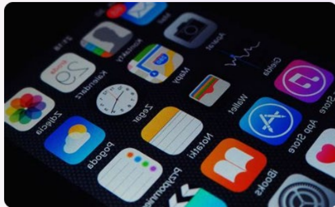
Invasão de dispositivos