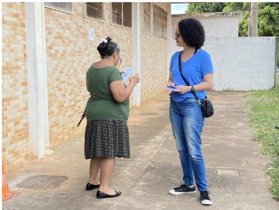
Figura 8 - Durante a distribuição, o público pôde tirar dúvidas com relação às políticas públicas de segurança alimentar e nutricional no DF