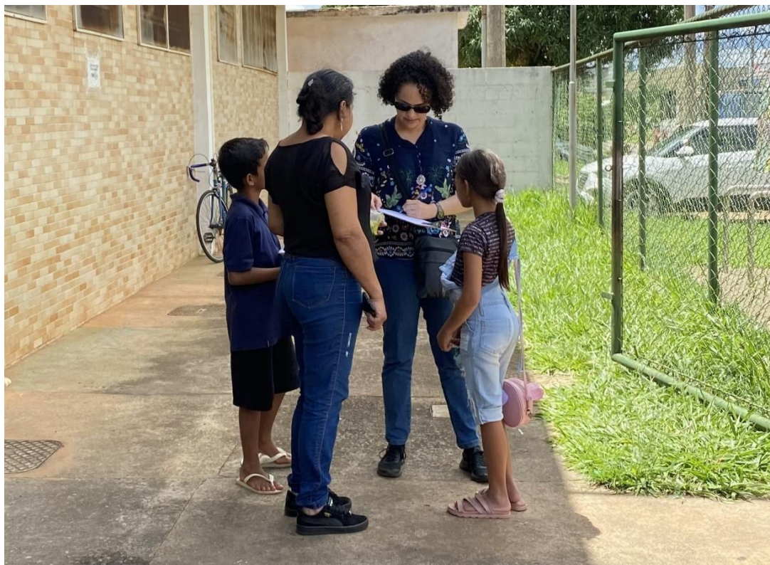
Figura 4 - Os questionários foram aplicados no momento em que os usuários saíam do Restaurante