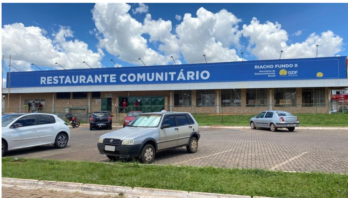
Figura 1 - Fachada do Restaurante Comunitário do Riacho Fundo II