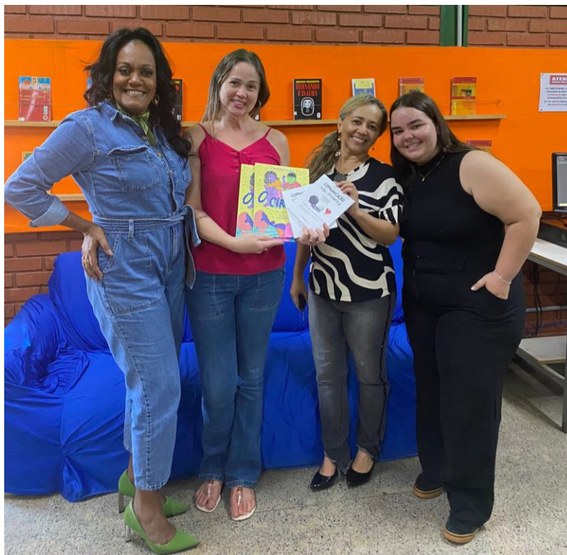
A diretora da escola entregou à responsável pela Biblioteca os livros doados para serem catalogados e ficarem à disposição dos alunos.