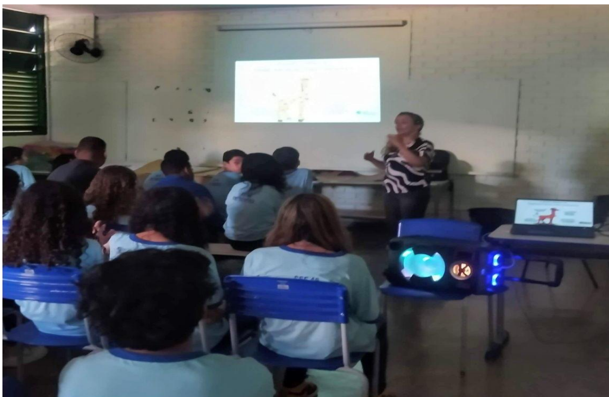
Explicação sobre o Símbolo da CNV - A Girafa