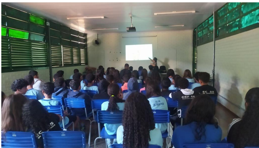
Explicação sobre o que é a Comunicação não Violenta - E os alunos participaram fazendo perguntas