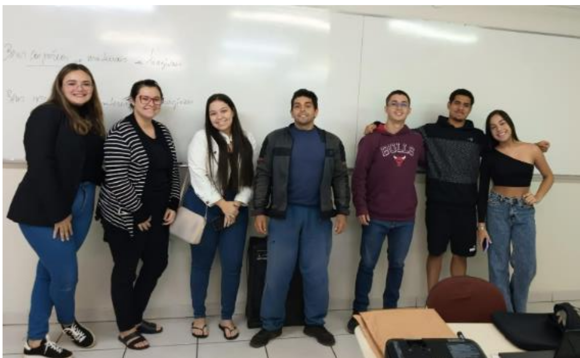
04) Fotos da visita: