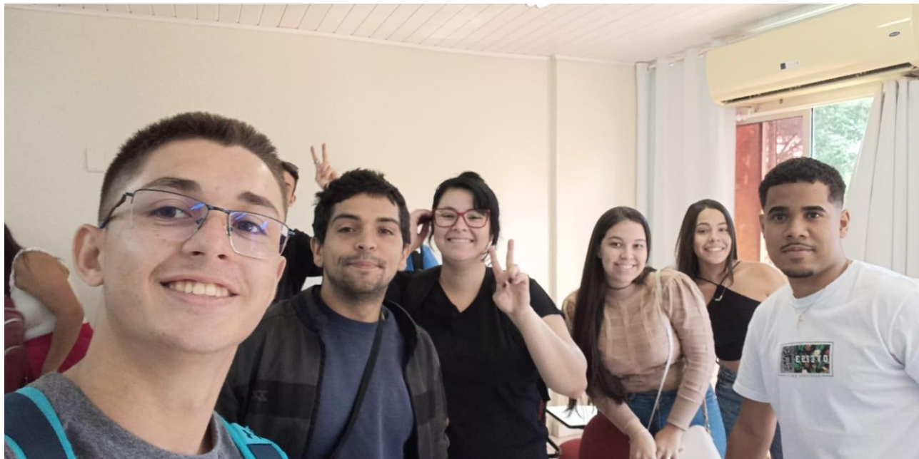
03) Fotos da apresentação do trabalho: