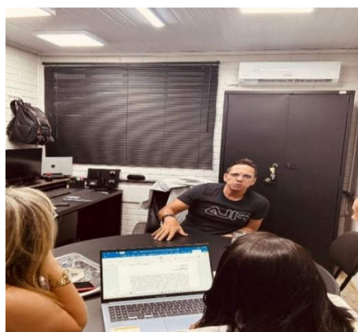
Anexo II – Primeira reunião com a supervisão e financeiro da escola