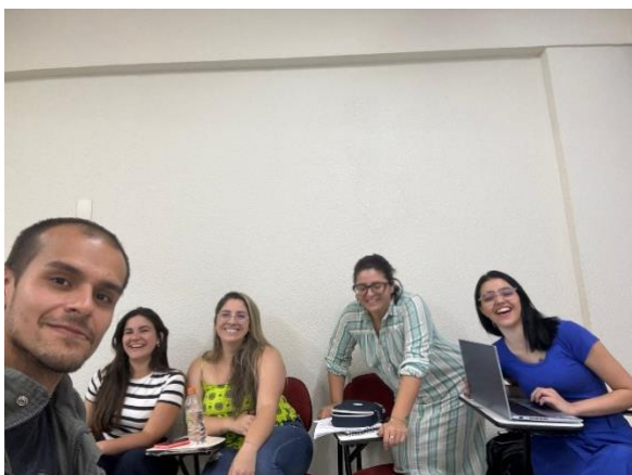
Anexo I - Reunião para organização do projeto