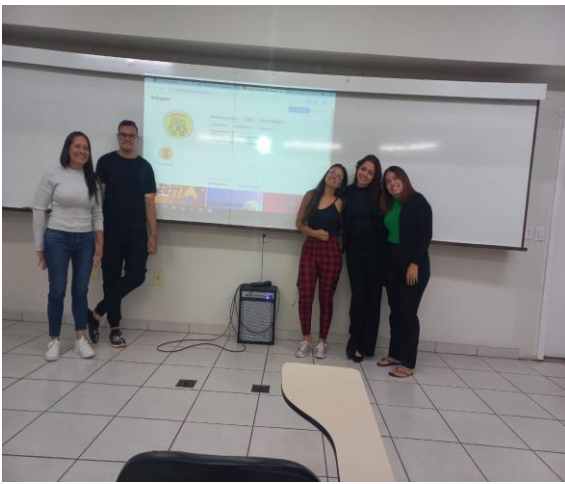
Dia 17/10/2024 – Apresentamos nosso projeto em sala e nossa pagina no instagram.