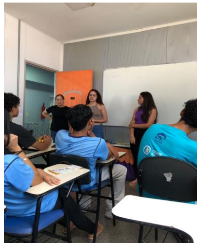
Dia 29/10/2024 – foi feito uma visita a casa azul de samambaia onde apresentamos nosso projeto para os alunos e entregamos uma cartilha com informações do projeto.