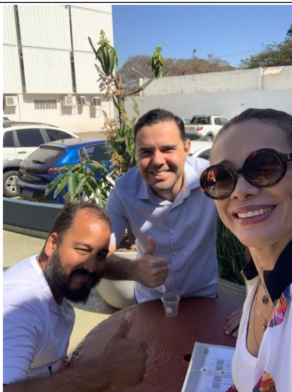
03) Fotos da apresentação do trabalho: