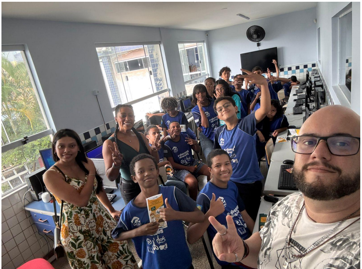
Alunos da Instituição Casa Azul com os panfletos distribuídos durante a Palestra