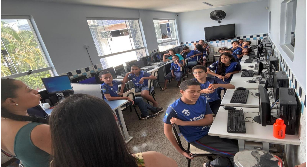
Momento da palestra para os alunos da Instituição Casa Azul