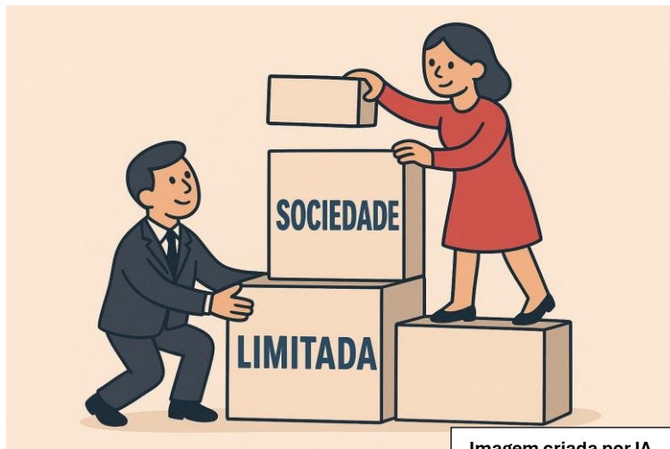
Imagem criada por IA

é uma empresa formada por dois ou mais sócios que se unem para formar um negócio. Essa relação entre os sócios é, popularmente, comparada a um “casamento”. Isso porque precisa existir vontade, confiança e disposição para se formar e manter uma sociedade. Esse vínculo entre sócios ou “afeição societária” ( Affectio societatis )