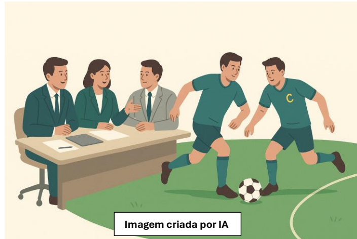
Imagem criada por IA

As deliberações podem ser realizadas em reunião ou assembleia, dependendo do número de sócios e das disposições no contrato social.