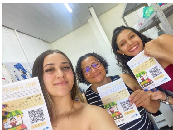
5º - QR CODE cartilha: